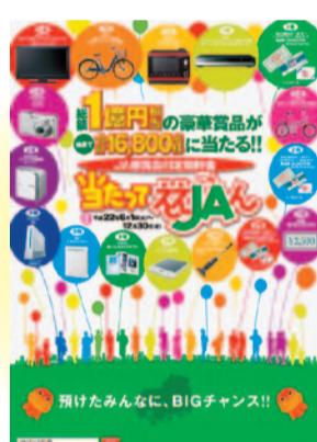
JA懸賞品付定期貯金『当たってええJAん』 (平成22年6月～12月)

JAバンク広島では、皆さまに喜んでいただける貯金商品として「JA懸賞品付定期貯金『当たってええJAん』」、「サンフレッチェ広島応援定期積金」「JAギフト付定期積金『食卓便』」の県内統一キャンペーンを行いました。