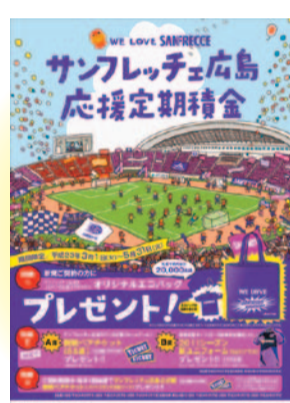
サンフレッチェ広島応援定期積金 (平成23年3月～5月)