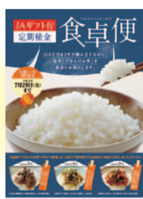
JAギフト付定期積金『食卓便』 (平成23年3月～7月)